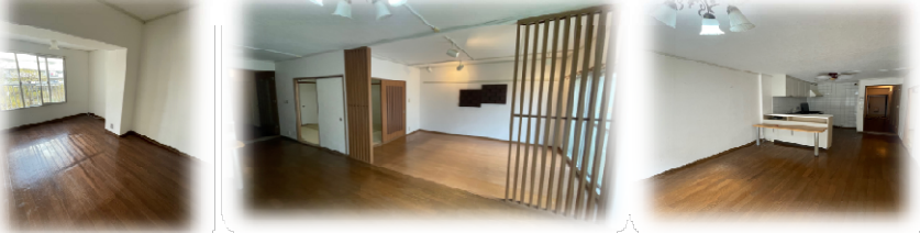
南西洋室とLDKの間には間仕切りがないため2LDKの表記としております。