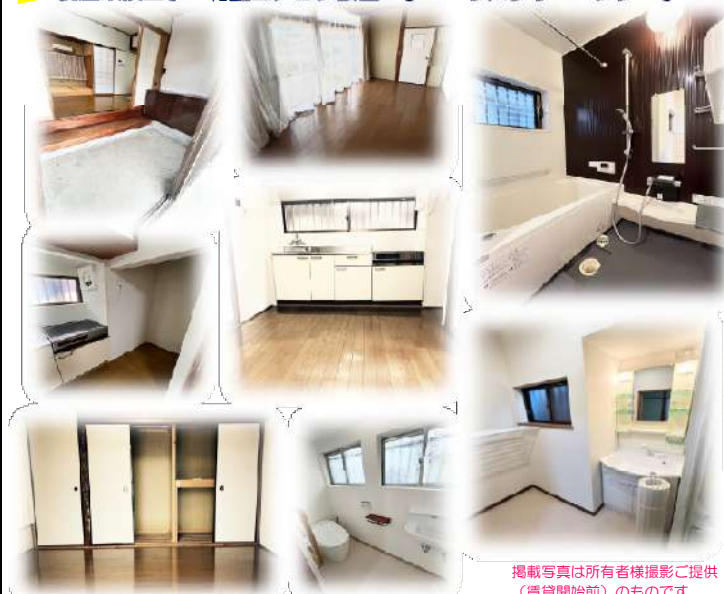
掲載写真是所有者様撮影ご提供（賃貸開始前）のものです。